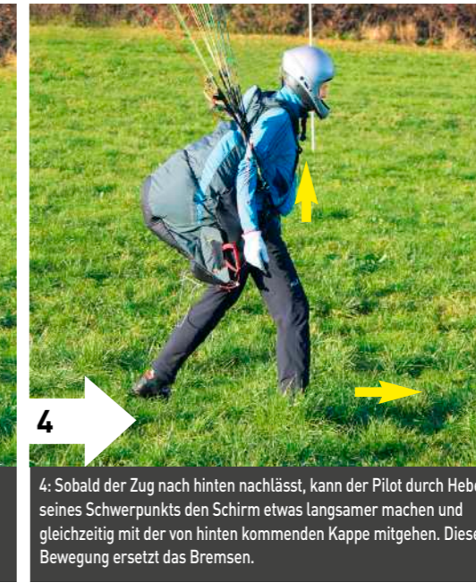
4: Sobald der Zug nach hinten nachlässt, kann der Pilot durch Heben seines Schwerpunkts den Schirm etwas langsamer machen und gleichzeitig mit der von hinten kommenden Kappe mitgehen. Diese Bewegung ersetzt das Bremsen.