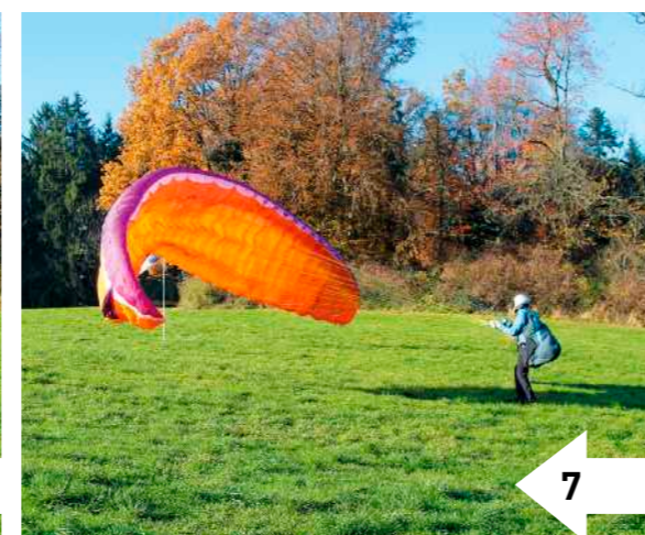
7: Der Pilot baut leichten Zug nach hinten auf und hebt die A-Gurte etwas an, um das Abkippen der Kappe weich abzusetzen.