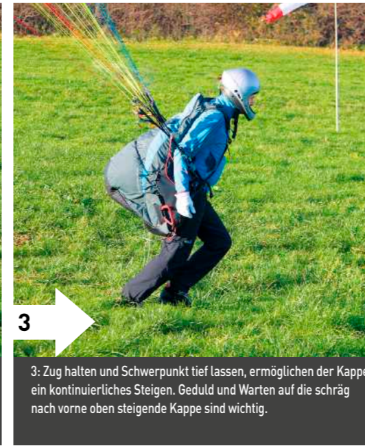
3: Zug halten und Schwerpunkt tief lassen, ermöglichen der Kappe ein kontinuierliches Steigen. Geduld und Warten auf die schräg nach vorne oben steigende Kappe sind wichtig.