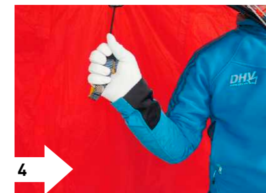
4 4. Ergonomischer Griff: durch Umschlagen des Seitensteges (wie im Film Starten, Steuern, Landen gezeigt). Direkter Kontakt; Steuern im Zugbereich. Steuergriff kann kaum aus der Hand rutschen. Seitensteg muss umgeklappt werden.