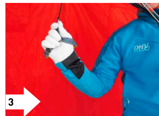
3 3. Schistockgriff: direkter Kontakt; Steuergriff kann kaum aus der Hand rutschen. Bei stärkerem Wind nicht empfehlenswert, da die Möglichkeit von gefesselt werden besteht und Griffwechsel länger dauern.