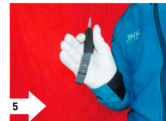
5 5 und 6. Ergonomischer Griff mit fixiertem Seitensteg durch angehängtes Klettband: optimaler Kompromiss; direkter Kontakt; Steuern im Zugbereich. Steuergriff kann kaum aus der Hand rutschen.