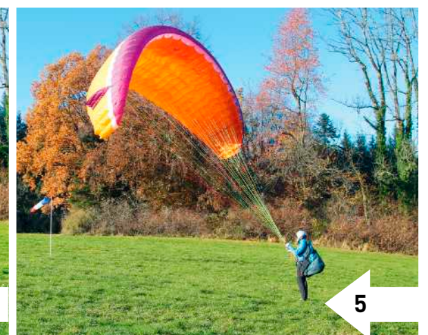
5: Zum Ablegen muss der Pilot die Steuerleinen am Körper entlang nach unten ziehen, unten halten und evtl. langsam rückwärts gehen. Durch diese Relativbewegung Pilot – Kappe stellt sich der Schirm schräg.