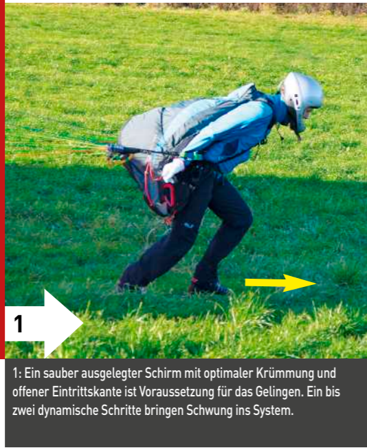
1: Ein sauber ausgelegter Schirm mit optimaler Krümmung und offener Eintrittskante ist Voraussetzung für das Gelingen. Ein bis zwei dynamische Schritte bringen Schwung ins System.

Aufziehen und Stabilisieren ohne Tragegurte und ohne Bremsen: Diese Übung kann vorwärts und rückwärts ausgeführt werden und soll nur in ebenem Gelände bei mäßigem Wind trainiert werden. Der Pilot spürt die Reaktionen seines Schirms auf Zug, sowie die Kontrolle des Anstellwinkels über die Relativbewegung Pilot - Kappe. Hier wird die schwierigere Variante vorwärts näher erläutert.