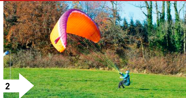
2: Dosieren der Steiggeschwindigkeit des Schirms. Beschleunigt wird die Kappe durch Stemmen und Absitzen. Langsamer wird die Kappe, wenn sich der Pilot unter den Schirm ziehen lässt.