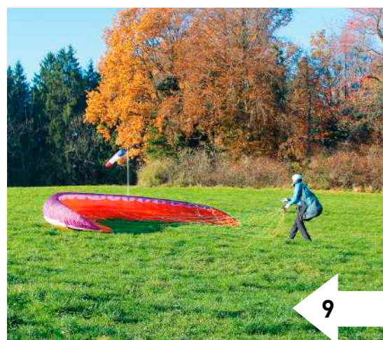
9: Wenn es der Pilot schafft, die Kappe so sauber abzulegen, ist er gut geübt und vorbereitet für ein Aufziehen des Schirms mit parallelen Armen und den Händen an jeweils einem A-Gurt.

Nach dem Auslegen der Kappe mit Windunterstützung (Info 158/S. 35) und dem rückwärts Einhängen der Tragegurte (Info 162/S.48ff.) nimmt der Pilot