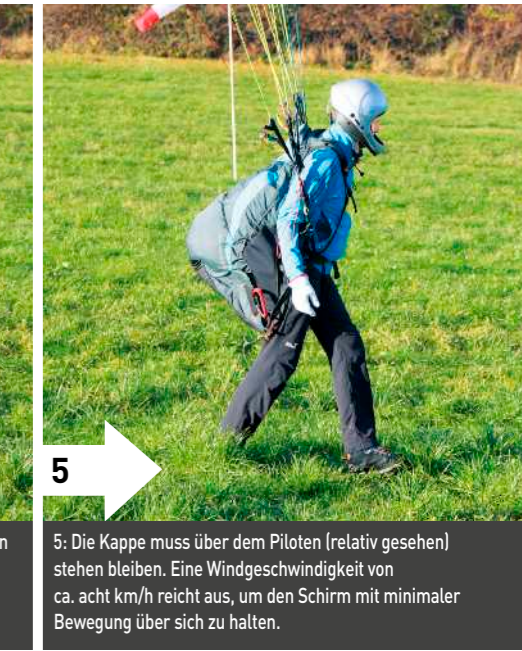
5: Die Kappe muss über dem Piloten (relativ gesehen) stehen bleiben. Eine Windgeschwindigkeit von ca. acht km/h reicht aus, um den Schirm mit minimaler Bewegung über sich zu halten.

die Grundhaltung mit einer freien Steuerhand, beiden A-Tragegurten in der anderen Hand und einer leichten Asymmetrie ein.