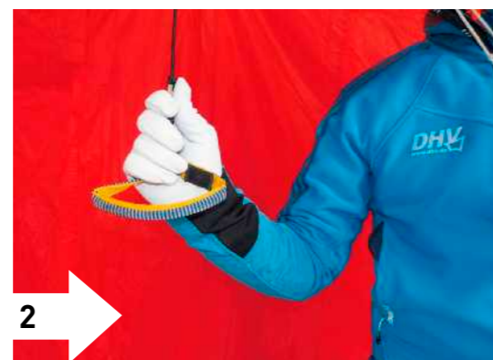
2 2. Ungarngriff: direktes Greifen möglich. Direkter Kontakt; Steuern im Zugbereich. Steuergriff kann eventuell leicht aus der Hand rutschen.