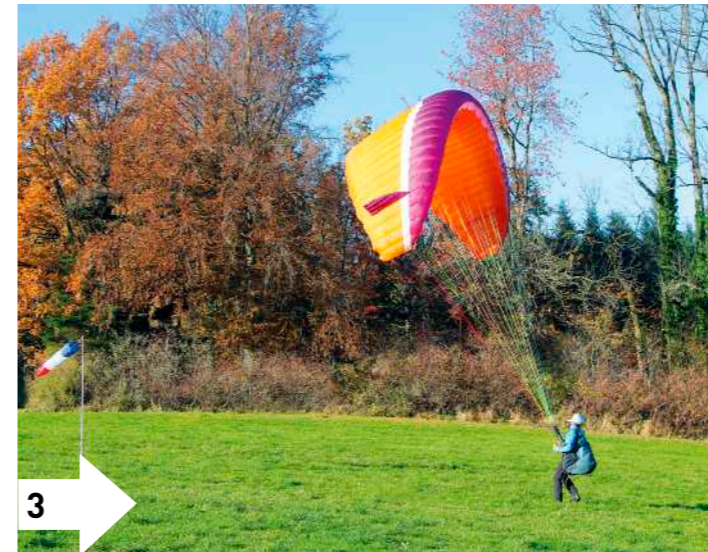
3: Beginn Stabilisierungsphase: Die Hand löst sich von den A-Gurten; beide Bremsen gehen auf Kontakt und erspüren den Steuerdruck. Der Pilot macht ein bis zwei Schritte rückwärts, um sich der Geschwindigkeit der Kappe anzupassen.