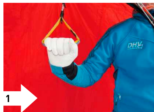
1 1. Konventioneller Griff: wenig Gefühl durch undefiniertes Spiel. Ungünstige Hebelverhältnisse durch waagrechten Unterarm. Steuern im Übergangsbereich Zug - Druck.