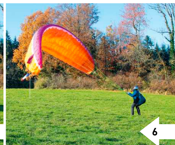
6: Geht der Pilot jetzt ein bis zwei Schritte auf den Schirm zu, beginnt die Kappe nach hinten abzukippen. Die Bremsen werden gelöst, die A-Gurte knapp unterhalb der Leinenschlösser von außen gefasst.