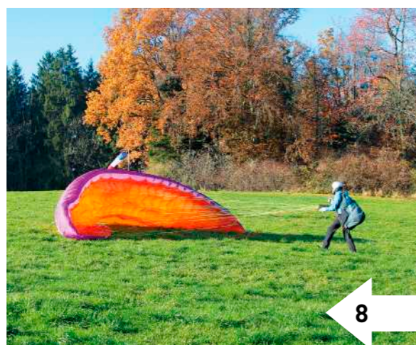
8: Sobald die Hinterkante den Boden berührt, muss der Pilot dem Schirm entgegen gehen, um die Eintrittskante offen zu halten und die Kappe mit der optimalen Krümmung abzulegen.