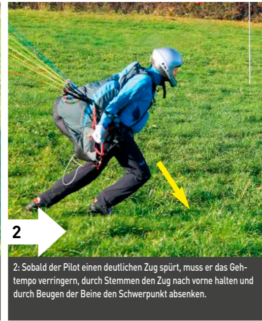
2: Sobald der Pilot einen deutlichen Zug spürt, muss er das Gehetempo verringern, durch Stemmen den Zug nach vorne halten und durch Beugen der Beine den Schwerpunkt absenken.