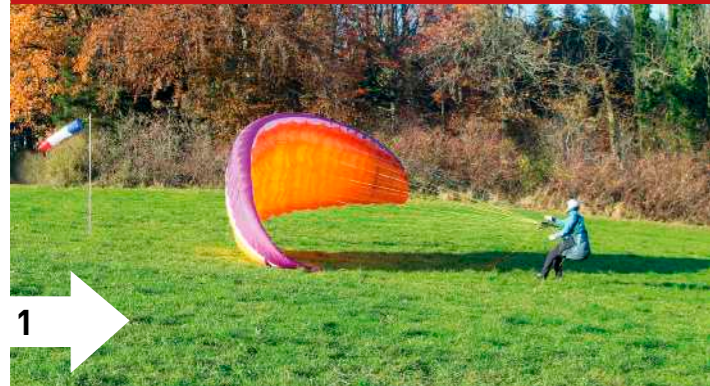
1: Mit einem Schritt nach hinten und Anheben der A-Gurte kommt Schwung ins System. Der Blick ist auf die Eintrittskante gerichtet, um mit der freien Steuerhand ein symmetrisches Hochsteigen der Kappe zu gewährleisten.

Das Ziel, seinen Schirm längere Zeit über sich zu halten, kann nicht sofort erreicht werden. Der Pilot muss sich Stück für Stück an dieses Ziel herantasten. Deshalb ist die Grundlage eines Lernerfolges, dass der Pilot seinen Schirm immer kontrolliert so ablegt, dass nach einer kurzen Konzentrationsphase sofort eine nächste Übung möglich ist. Das erste wichtige Ziel muss es sein, dass der Schirm vernünftig am Boden liegt, um die Übung zu wiederholen. Kommt die Kappe in irgendeiner Form unerwartet schief etc., oder fühlt sich der Pilot überfordert, legt er die Kappe wieder ordentlich ab. Das Stabilisieren soll anfangs nur ein Stoppen der Kappe sein, dann ein bis zwei Sekunden dauern und zeitlich wirklich nur langsam gesteigert werden. Wenn der Pilot die Kontrolle über den Schirm verliert und die Kappe irgendwie zu Boden kracht, ist dies ein deutliches Zeichen, dass er sich überfordert hat.