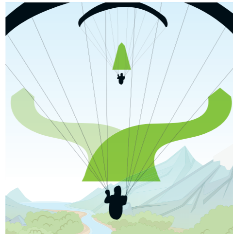
Überholen: Mit sicherem Abstand rechts. Nur wenn rechts nicht möglich, mit sicherem Abstand links.