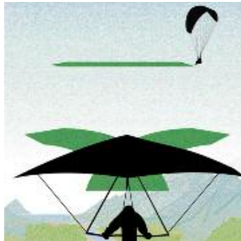
Kreuzender Kurs: Das von links kommende Fluggerät muss ausweichen.