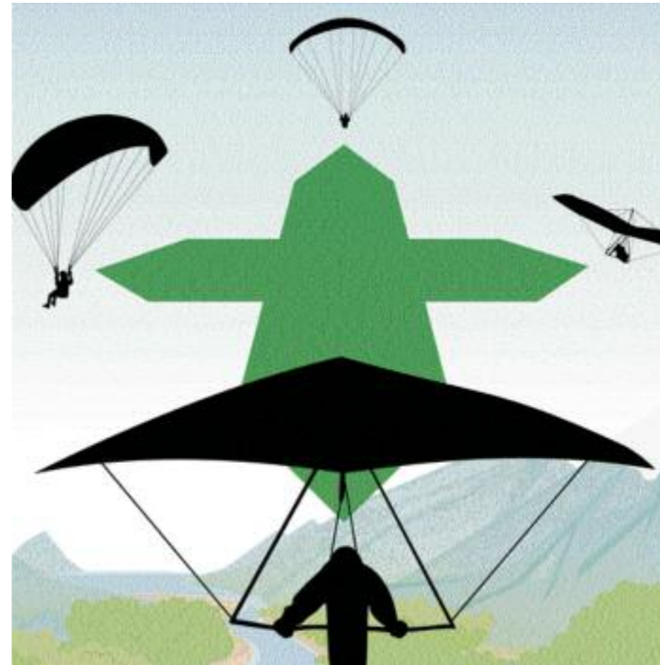
Halte immer sicheren Abstand!