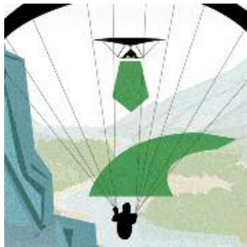
Soaren am Hang: Das Fluggerät mit dem Hang an der linken Seite weicht nach rechts aus.