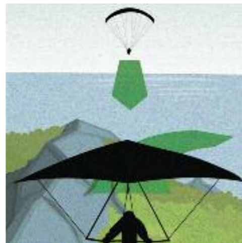
Soaren oberhalb des Hangs: Das Fluggerät mit dem Lee an der linken Seite weicht nach rechts aus.