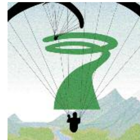
Thermik: Das erste in der Thermik kreisende Fluggerät gibt die Drehrichtung für alle vor.