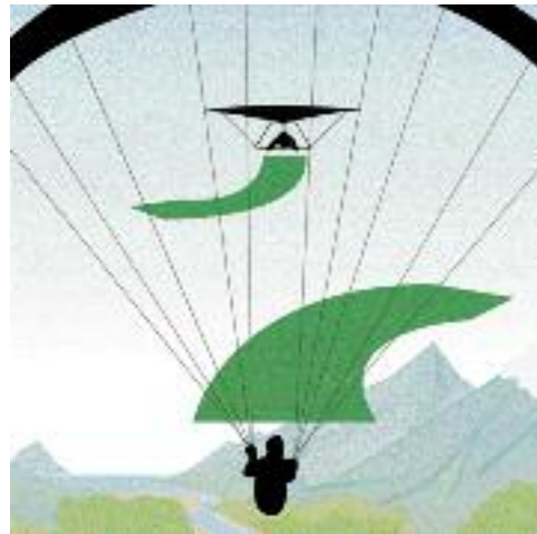
Gegenkurs: Beide Fluggeräte weichen nach rechts aus.