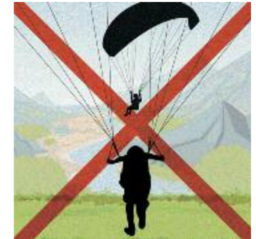
Start: Ein Start darf erst erfolgen, wenn keine Kollisionsgefahr besteht.

In Europa fehlt bisher eine verbindliche gemeinsame gesetzliche Grundlage für Ausweichregeln beim Thermikfliegen und Hangsoaren für Gleitschirm- und Drachenflieger. Der Europaverband der Gleitschirm- und Drachenflieger (EHPU) hat deshalb die wichtigsten gemeinsamen Regeln, die in allen Ländern gültig sind, zusammengefasst. Es ist jedoch zu beachten, dass die Regeln zum Thermikfliegen und Hangsoaren in einigen Ländern nur als Empfehlung des nationalen Pilotenverbandes angesehen werden können, nicht als gesetzliche Vorschrift. Grundsätzlich empfiehlt die EHPU, sich bei Flügen im Ausland auf den Websites der nationalen Pilotenverbände über die Flugregeln zu informieren. www.ehpu.org