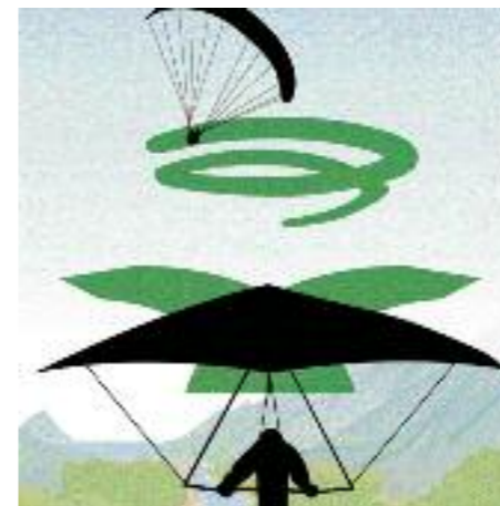
Thermik: Im Aufwind kreisenden Fluggeräten muss ausgewichen werden. Aber: Am Hang haben die Hangflugregeln Vorrang!