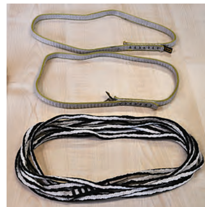
Material zur Fixierung am Baum sowie am Gurtzeug

ette benötigt. Anschließend alarmiert er im Falle einer Baumlandung den Einsatzleiter der zuständigen Bergwacht. Dieser wiederum wird alle nötigen Informationen für den Rettungseinsatz zusammentragen und seine Mannschaft alarmieren lassen. Es kann auch sein, dass der Einsatzleiter nochmals bei euch zurückruft, um die Gegebenheiten aus erster Hand abzugleichen. Anschließend dauert es ca. 10-15 Minuten, bis sich die Mannschaft an der Rettungswache sammelt und das Rettungsgerät zusammenstellt. Hier muss beachtet werden, dass die Arbeit bei der Bergwacht komplett ehrenamtlich ist und die Retter teilweise direkt von ihrem Arbeitsplatz zum Einsatz kommen. Anschließend fährt die Mannschaft zum Unfallort. Sollte dieser sehr abgelegen, oder nicht in angemessener Zeit erreichbar sein, werden die Retter per Hubschrauber in die Nähe des Einsatzortes gebracht. Man muss sich nicht wundern, wenn der Helikopter einen großen Bogen um die Einsatzstelle fliegt. Das dient dem Schutz des Verunglückten, weil der Downwash, also der Wind, den der Hubschrauber als Auftrieb erzeugt, den Schirm samt Piloten aus dem Baum reißen könnte. Die Retter kommen vom Absetzpunkt zu Fuß an die Unfallstelle.