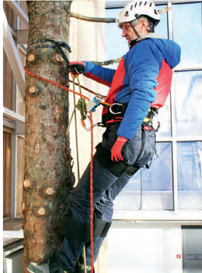
Baumsteigetechnik Bergwacht Bayern

Viele denken, die Bergwacht sei ausschließlich für Kletterunfälle und Bergsteiger zuständig. Allerdings sind die Aufgaben weit vielfältiger. Allein in 2015 wurden 128 Einsätze mit Drachen- und Gleitschirmbeteiligung alarmiert (116 Gleitschirm, 12 Drachen). Davon sind ein großer Teil Baumlandungen mit unverletzten bzw. leicht verletzten Piloten. Genau aus diesem Grund hat die Bergwacht Bayern bereits seit vielen Jahren ein standardisiertes Verfahren entwickelt, um Gleitschirmflieger aus Bäumen zu retten. Die Methode wurde im Laufe der Zeit immer weiter verbessert und auch die Ausrüstung den Ansprüchen angepasst. Dabei kommt der Bergwacht zugute, dass viele der Einsatzkräfte selbst Gleitschirmpiloten sind und somit ihr ganzes Knowhow in die Prozesse mit einfließen lassen können. Zum Sicherungssatz Baumrettung gehören u.a. Baumsteigeisen sowie kleine