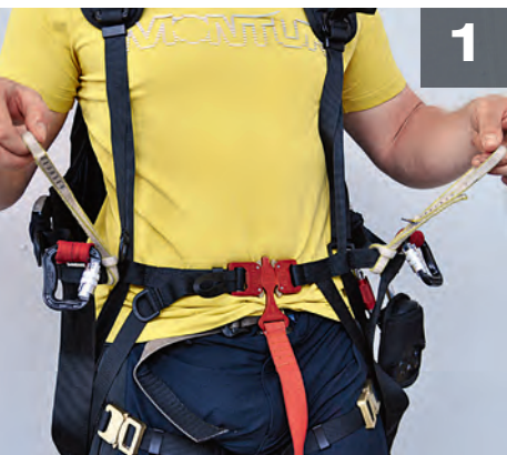
Bandschlingen im Gurtwinkel