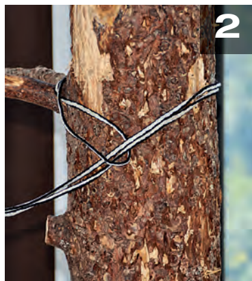
Sicherung mit Ankerstich um einen Baum