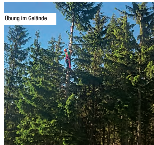
Übung im Gelände

droht, eher abzustürzen als hängen zu bleiben. Für die Retter befinden sich die Schwierigkeiten in der Aufhängeposition des Piloten. Wenn der Pilot unten am Trapez hängt, ist bei jedem Handgriff der Drachen im Weg. Dennoch erfolgt die Rettung nach dem gleichen Schema wie beim Gleitschirm. Ein Retter steigt auf, sichert den Piloten lässt ihn schließlich zu Boden. Bei der Bergung des Drachens muss meistens ein erfahrener Drachenflieger behilflich sein, weil die wenigsten Bergretter Erfahrung im Abbau von Drachen haben.